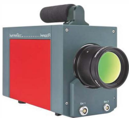
ImageIR® von InfraTec

Riesige Muldenkipper, wie der Komatsu 960E-1K, können mehr als 300 Tonnen abgebautes Gestein transportieren. Wenn sie sich dabei für mehrere Stunden auf steinigem Boden fortbewegen, ist die Belastung der Reifen enorm. Wie hoch genau, das ermittelt Bridgestone in Dauer- und Belastungstests in seinem Werk in Hofu im Südwesten Japans. Im Rahmen dieser Checks werden die unterschiedlichen Schichten des Reifens thermografisch untersucht. Zahlreiche Bohrlöcher in der Reifenkarkasse ermöglichen die Inspektion am Reifeninneren. Der Fokus bei den Außenprüfungen liegt hingegen besonders auf den peripheren Strukturen der Reifen.